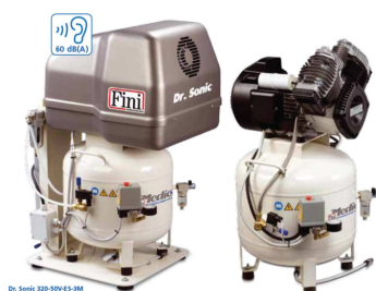
Model 210 og 320