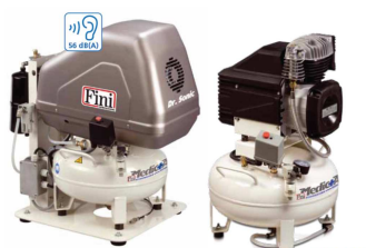
Model 102 og 160